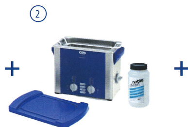
Nettoyage aux ultrasons avec Elmasonic et produits chimiques Elma Clean