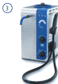
Rinçage à la vapeur Elmasteam