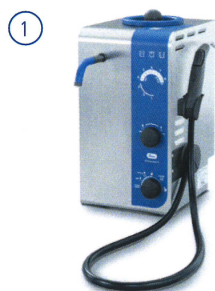
Pré-nettoyage à la vapeur Elmasteam

A titre d'exemple, nous vous présentons une application spécialement dédiée au polissage.